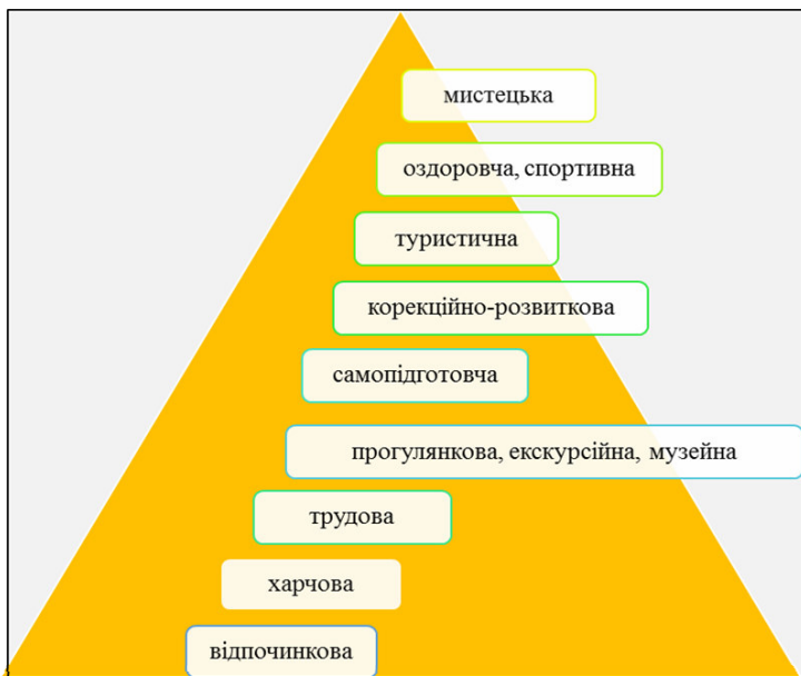
Рис. 3. Виховна полісистемність другої половини дня у закладі

Виховна полісистемність другої половини дня (Рис. 3) у закладі: